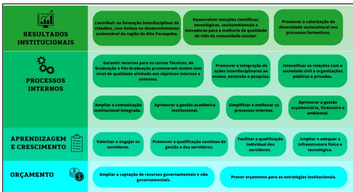
Figura 2: Mapa Estratégico de Gestão

Uma visão geral dos planos e compromissos que integram essa proposta de gestão é apresentada na figura Mapa Estratégico de Gestão . Em seguida, esses planos são detalhados e agrupados nos seguintes temas: (a) Servidores e Gestão de Pessoas, (b) Estudantes e Comunidade, (c) Ensino, (d) Extensão, (e) Pesquisa, Inovação e Pós-Graduação e (f) Administração e Planejamento.