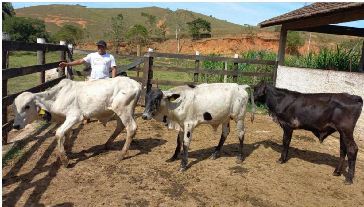
Brinco nº 20, 25 e 26 - Romeu, Trovão e Raio