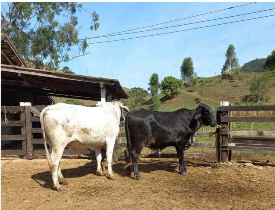
Brinco nº 10 e 11 Jardim e Marrom Negro.