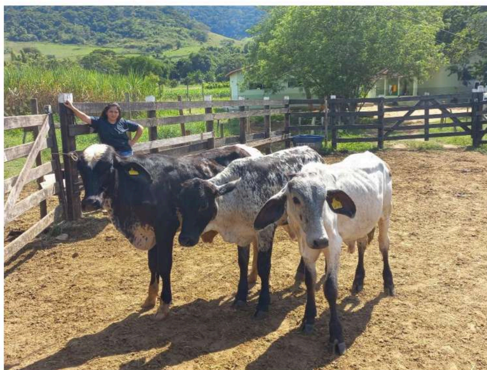
Brinco nº 21, 23 e 24- Herói, Thor, Astro