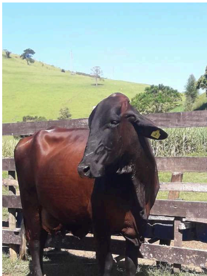
Brinco nº 2 - Azeitona