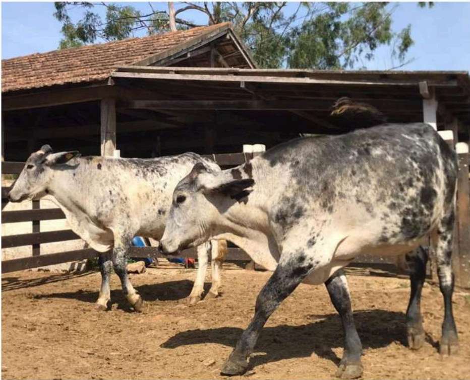
Brinco nº 13 e 15 Vilão e Zé Branco