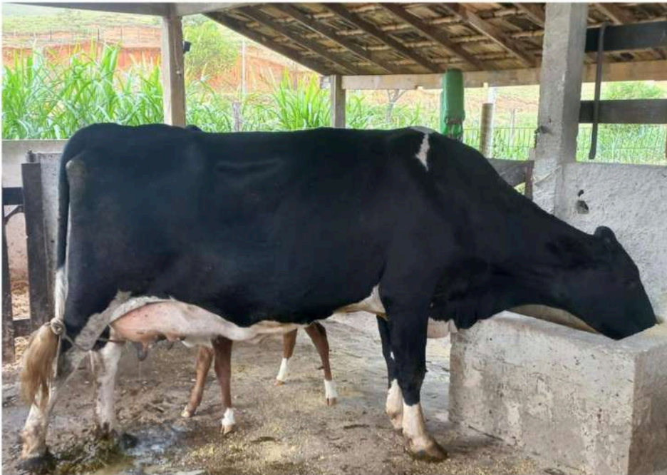
Brinco nº 9 -Lembrança