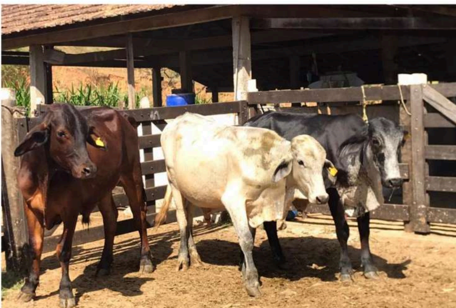
Brinco nº 11, 12 e 16 Chocolate, Antonio Valão