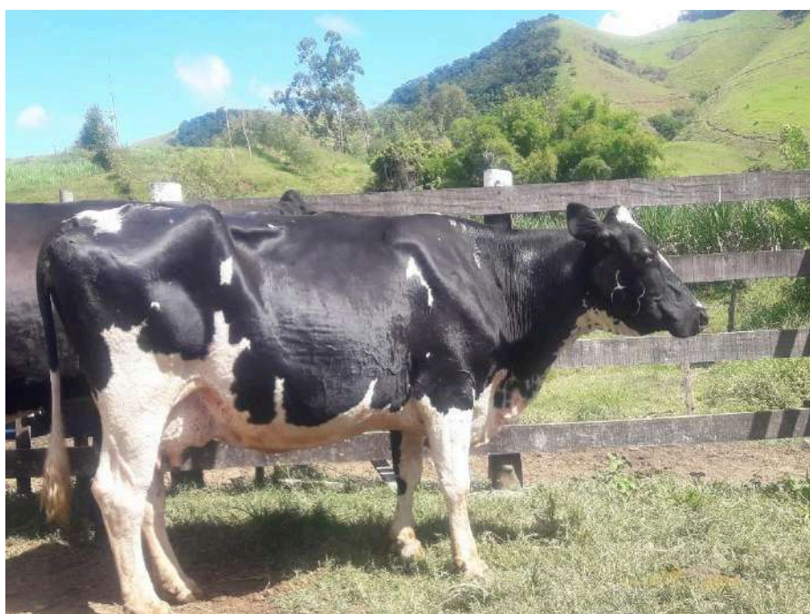
Brinco nº 8 - Bordada