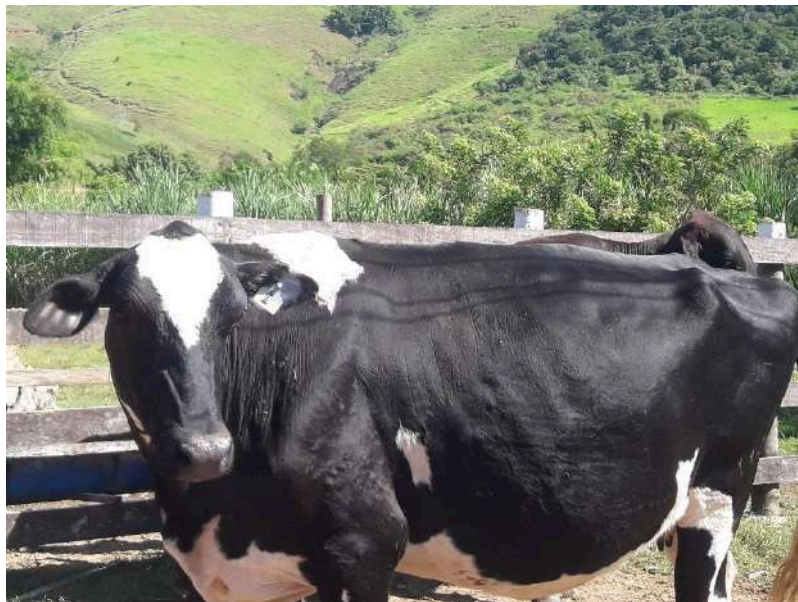
Brinco nº 1 - Esperança