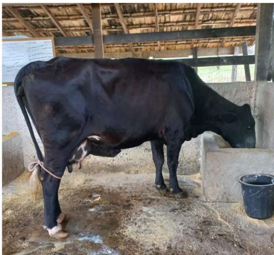
Brinco nº 7 - Maravilha