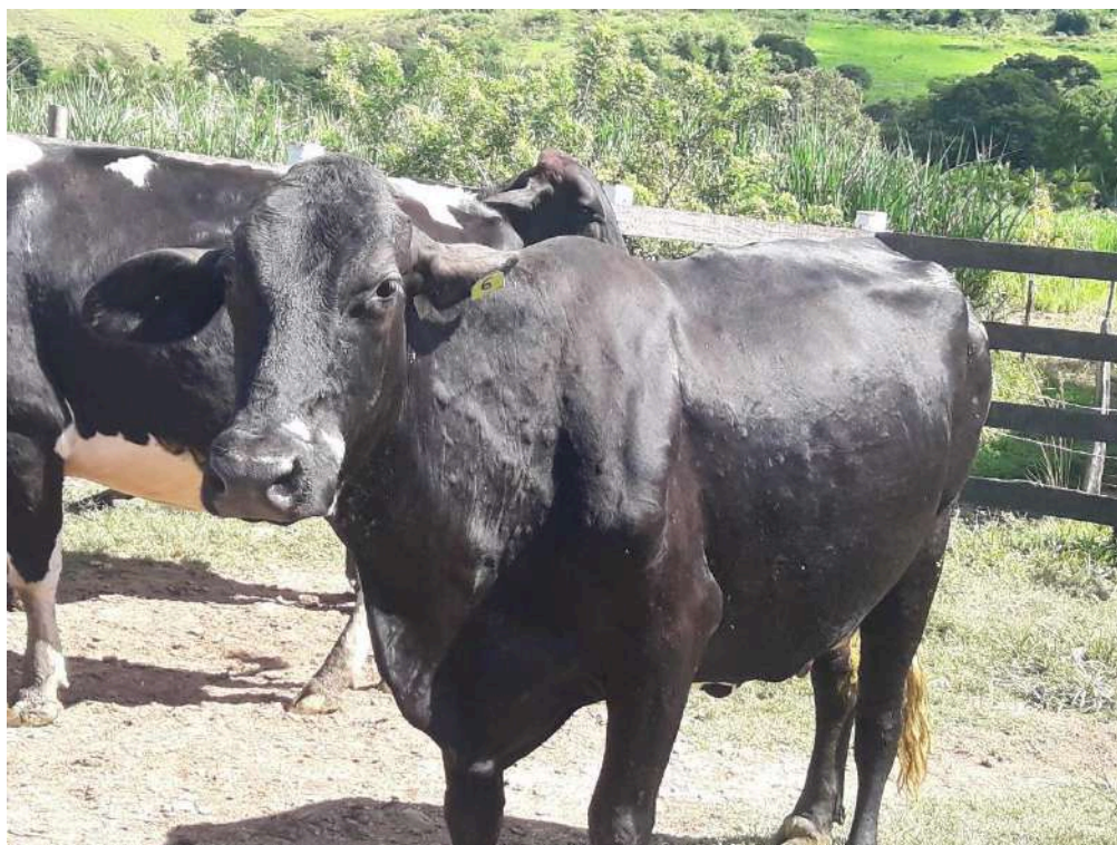
Brinco nº 6 - Cabiúna