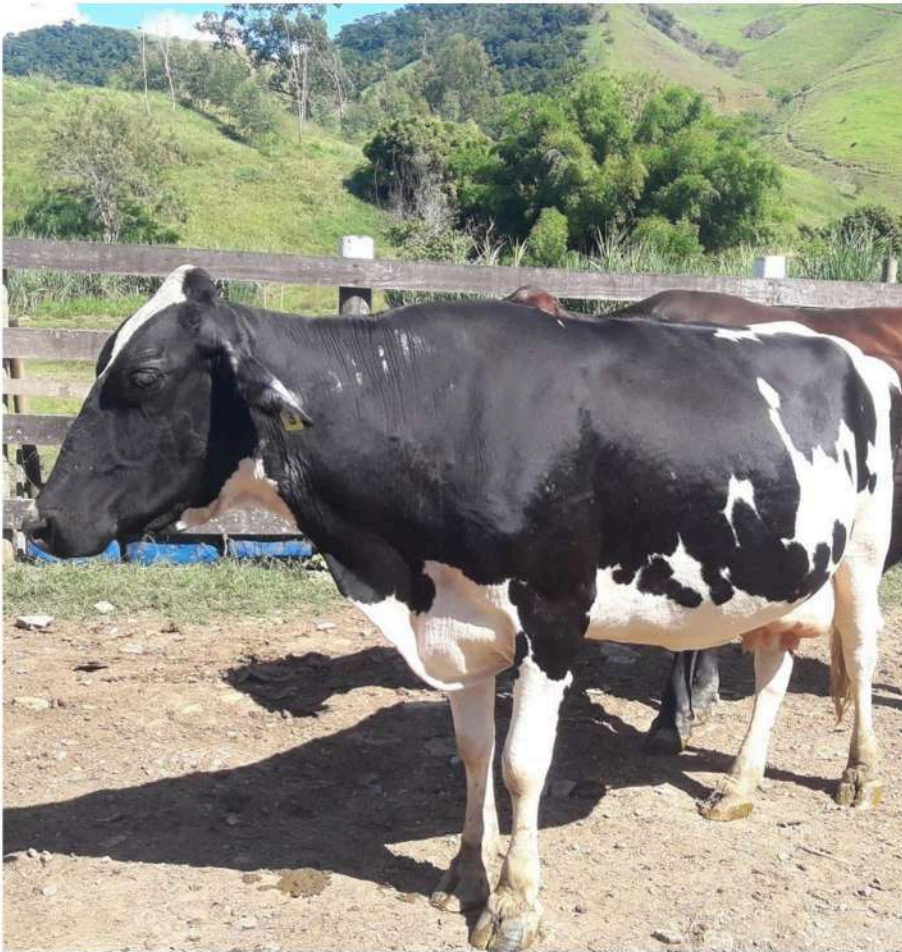
Brinco nº 3 - Pintura