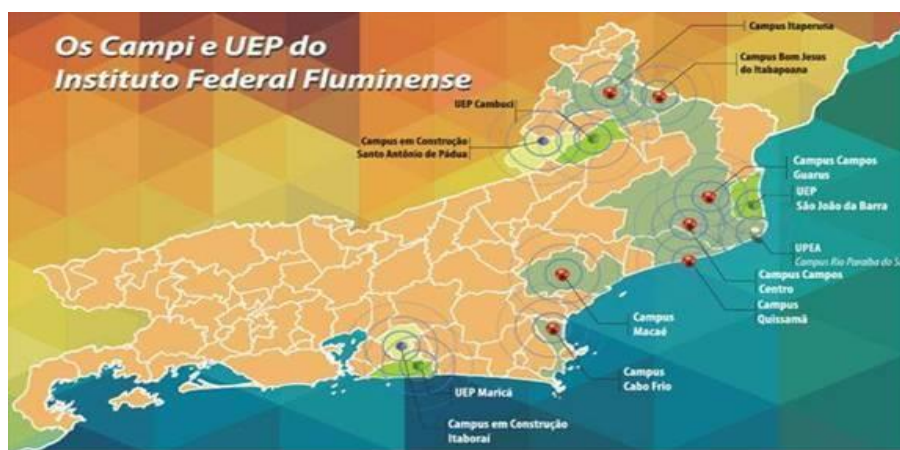
Figura 4- Mapa dos campi e Unidades de Ensino Profissional (UEP)

Vale lembrar também que o Instituto Federal Fluminense tem-se expandido para diversas cidades fluminenses, havendo atualmente unidades em: Campos dos Goytacazes ( Campus Campos Centro, Campus Campos Guarus), São João da Barra (Polo de Inovação), Macaé, Cabo Frio, Itaboraí, Santo Antônio de Pádua, Itaperuna e Bom Jesus do Itabapoana . Alguns postos avançados também são encontrados nas cidades de Cordeiro, Cambuci e Maricá. A figura 4 exibe algumas dessas unidades.