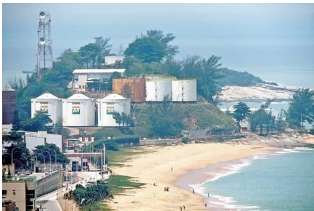
Figura 1- Panorâmica do Porto de Imbetiba, em Macaé/RJ, operado pela Petrobrás (O PETROLEO, 2018)

A descoberta da fronteira petrolífera do pré-sal acelerou ainda mais as atividades desse ramo – figura 2. Os grandes estaleiros do entorno da Baía da Guanabara, que faliram ou estavam quase que fechados nos anos 1990, voltaram a apresentar atividades industriais significativas, principalmente pela política de incentivo da PETROBRAS de nacionalização de 65% das peças e equipamentos empregados no ramo petrolífero. No entanto, a crise econômica de 2008 acendeu um alerta nas empresas do setor, que reduziram custos operacionais e número de empregos.