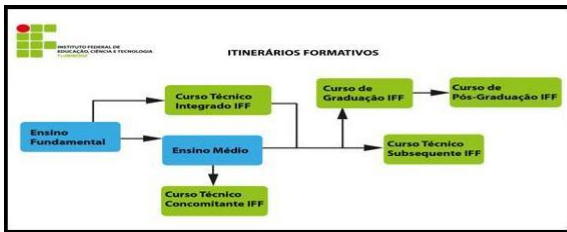
Figura 5- Itinerários Formativos no Instituto Federal Fluminense (IFFLUMINENSE, 2015)

- Cursos Técnicos Concomitantes com possibilidade de obtenção de certificação parcial de acordo com a terminalidade dos módulos. Neste caso alunos do Ensino Médio de outras instituições também podem ingressar nos Cursos Técnicos de Nível Médio do Instituto Federal Fluminense. A instituição dispõe de um Processo de acesso diferenciado, conhecido como Concomitância Externa, específico para acesso de alunos da rede pública.