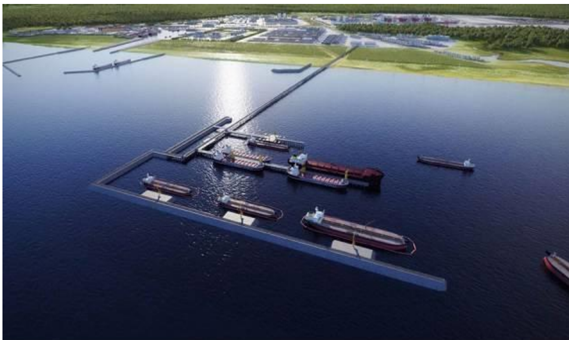
Figura 3- Panorâmica do Porto do Açu em São João da Barra/RJ

Outras considerações devem ser enfatizadas em favor da indústria da região Norte Fluminense. Está em andamento o planejamento de um novo traçado da linha férrea ligando o Rio de Janeiro até Vitória. Este novo trecho poderá interligar o complexo portuário do Açu aos dois dos principais portos nacionais. Esforços nessa direção têm sido envidados por ambos os governos, o que ajudará a recuperar na região a vocação para o transporte ferroviário, que já contou com importantes estações e extensa malha para operação de locomotivas da Leopoldina Railways, posteriormente intitulada Estrada de Ferro da Leopoldina, uma subsidiária da extinta estatal Rede Ferroviária Federal (RFFSA), que tinha portentosas instalações de manutenção em Campos dos Goytacazes/RJ, o que também contribuía para a geração de emprego e de riqueza na região.