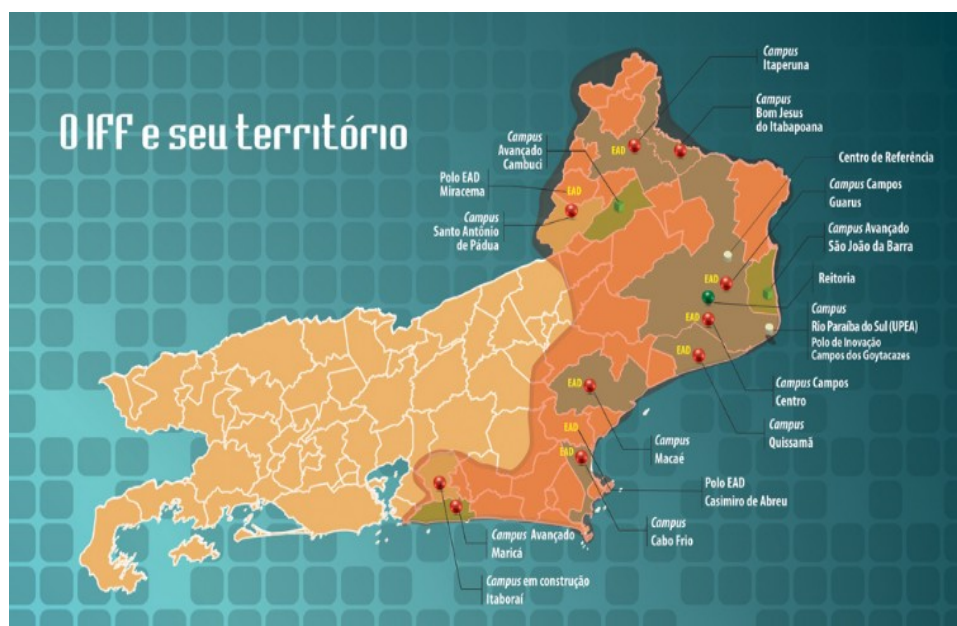
Figura 1: Mapa da abrangência regional do Instituto Federal Fluminense

Atualmente, integram o IFFluminense, os seguintes campi : (i) na mesorregião do Norte Fluminense, os campi Campos-Centro, Campos-Guarus e, ainda o Centro de Referência em Desenvolvimento de Tecnologias Educacionais com sedes no município de Campos dos Goytacazes; o Campus avançado de São João da Barra e a Unidade de Pesquisa e Extensão Agroambiental de Rio Paraíba do Sul, em São João da Barra; o Campus Macaé; o Campus Quissamã; (ii) na mesorregião do Noroeste Fluminense, os campi Santo Antônio de Pádua, que conta com uma Unidade de Formação Profissional com sede no município de Cordeiro - RJ; Bom Jesus do Itabapoana que conta com um Campus avançado em Cambuci e o Campus Itaperuna, que também conta com dois pólos de Educação a Distância: um na própria cidade, e outro localizado em Miracema; (iii) na mesorregião da Baixada Litorânea, o Campus Cabo Frio (região dos lagos); e, por fim, (iv) na mesorregião Metropolitana do Rio de Janeiro, em fase de implantação, o Campus Itaboraí e o Campus Maricá.