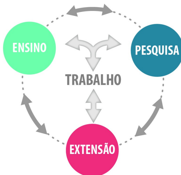
Figura 4: Trabalho, Ensino, Pesquisa e Extensão